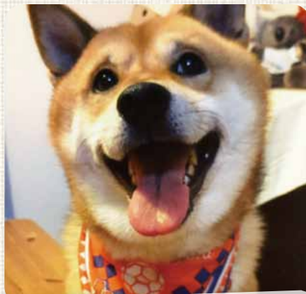
ポン太 江南区 早通 今月はお気に入りのアルビのバンダナだよ!!

次号のわたしのさんぽみちは12月1日(月)の朝刊に折り込まれます。どうぞお楽しみに!