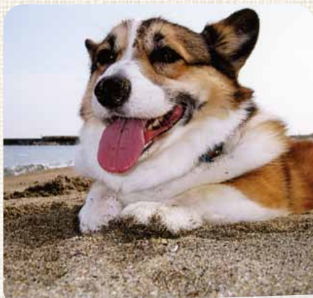
キング 江南区 いぶき野 砂浜で穴を掘るのが大好きです